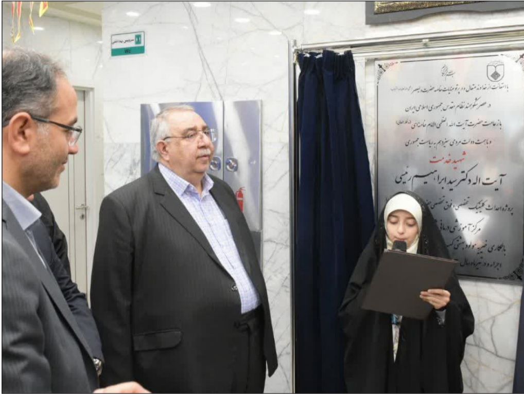
افتتاح پلی کلینیک تخصصی و فوق تخصصی حضرت خدیجه کبری (س)

چهارشنبه ۱۳ تیرماه، پلی کلینیک تخصصی و فوق تخصصی حضرت خدیجه کبری (س) با حضور معاون توسعه مدیریت و منابع وزارت بهداشت درمان و آموزش پزشکی، رئیس و معاونین دانشگاه، جمعی از نمایندگان مردم شریف اصفهان در مجلس شورای اسلامی، خیرین سلامت استان، جمعی از مدیران دانشگاه، رئیس و مسئولین مرکز آموزشی درمانی شهید دکتر بهشتی، افتتاح شد.