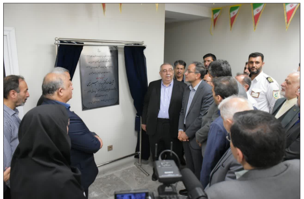
افتتاح پایون اساتید، دستیاران تخصصی و کارورزان مرکز آموزشی درمانی الزهرا (س)

نخستین سمپوزیوم کشوری پزشکی بازساختی و بیماری های مغز و اعصاب با حضور اساتید برجسته این حوزه از دانشگاه های علوم پزشکی اصفهان، تهران، مشهد و شیراز در روز پنجشنبه ۱۴ تیرماه به میزبانی دانشگاه برگزار گردید. در این سمپوزیوم که به طور مشترک توسط کارگروه پزشکی بازساختی و سلول های بنیادی دانشکده پزشکی و مرکز تحقیقات علوم اعصاب دانشگاه برگزار شد، آخرین دستاوردهای علمی پژوهشگران در حوزه کاربرد پزشکی بازساختی و سلول درمانی در بیماری های مالتیپل اسکلروز، اختلالات عصبی عضلانی، صرع، آسیب های نخاعی، فلج مغزی و استروک مورد بحث و تبادل نظر قرار گرفت.