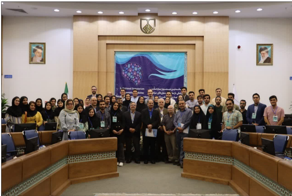
دانشگاه میزبان نخستین سمپوزیوم کشوری پزشکی بازساختی در بیماری های مغز و اعصاب

چهارشنبه ۱۳ تیرماه، با حضور وزیر کشور، رئیس و معاونین دانشگاه، خیرین سلامت استان و جمعی از مسئولین شهرستان ورزنه، بیمارستان ۴۲ تخت خوابی سردار شهید حاج قاسم سلیمانی در شهرستان ورزنه افتتاح رسمی و مورد بهره برداری قرار گرفت. شایان ذکر است با توجه به خواسته های مردم منطقه در خصوص ساخت یک مرکز درمانی، بیمارستان شهید حاج قاسم سلیمانی در سال ۱۳۹۳ کلنگ زنی و در سال ۱۴۰۲ تکمیل گردید. گفتنی است این بیمارستان با زیر بنایی ۱۴۰۰۰ متر مربع و با اعتباری بالغ بر ۲۱۰ میلیارد تومان مورد بهره برداری قرار گرفت.