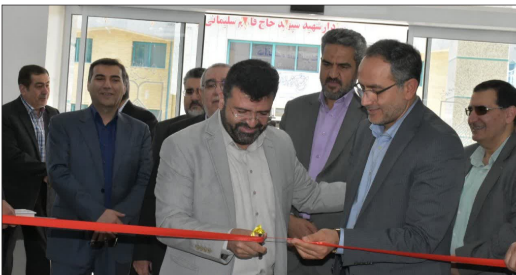
افتتاح وبهره برداری از ساختمان جدید اداری، آموزشی شهدای دانشکده دندانپزشکی