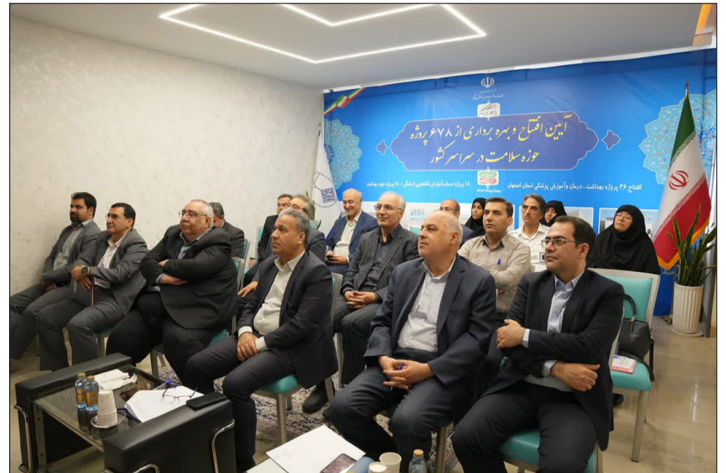
همزمان با سراسر کشور: افتتاح ۴۶ پروژه عمرانی دانشگاه در قالب پوشش یادگار ابراهیم

شنبه ۲ تیرماه، همزمان با انجام بزرگ ترین مراسم افتتاح در تاریخ نظام سلامت کشور و آیین بهره برداری از ۲۷۸ پروژه سلامت، «پروژه های بهداشتی، درمانی، آموزشی و دانشجویی فرهنگی دانشگاه علوم پزشکی اصفهان» نیز بصورت مجازی افتتاح و مورد بهره برداری قرار گرفت.