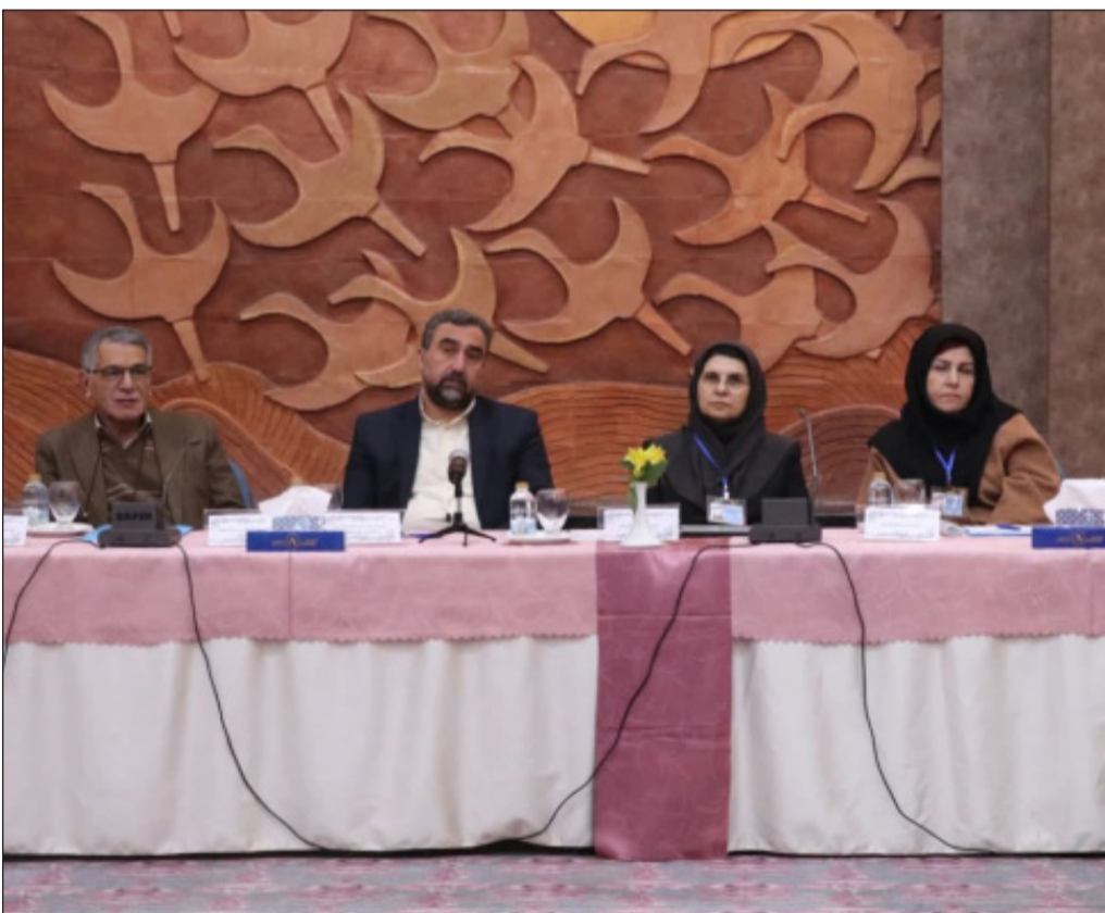
نشست کشوری مراقبت از بیماری‌های تنفسی با تاکید بر کووید ۱۹ و آنفولانزا

گفتنی است، این اجلاس به ریاست دکتر محمدرضا ظفرقندی وزیر بهداشت، درمان و آموزش پزشکی و با حضور دکتر محمدجعفر قائم پناه معاون اجرایی رئیس جمهور، مدیران و معاونین وزارت بهداشت و روسای دانشگاه‌های علوم پزشکی سراسر کشور برگزار شد و همفکری و همکاری بیش از پیش کادر سلامت و حل مشکلات و تبیین مهم‌ترین برنامه‌ها و اولویت‌های وزارت بهداشت در ستاد این وزارتخانه، مورد بحث و تبادل نظر قرار گرفت.