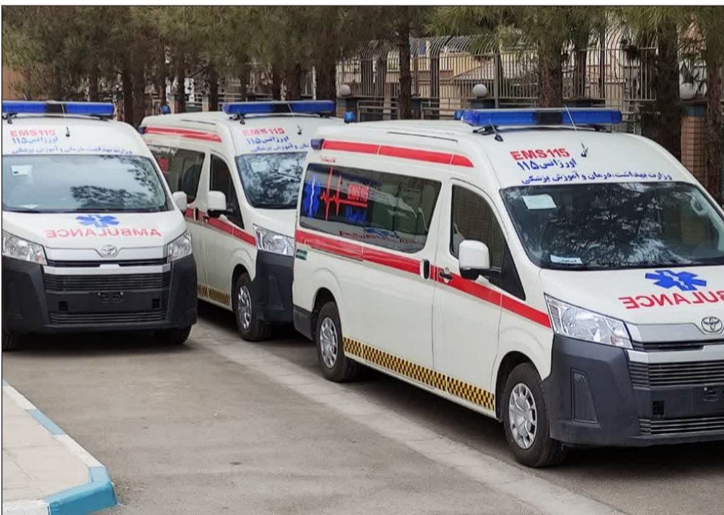
۴ دستگاه آمبولانس جدید به ناوگان اورژانس اصفهان اضافه شد

همچنین در پایان از ۴ واحد برتر تولید و صادرات، ۱۶ واحد تولید مواد غذایی و آشامیدنی برتر، ۱۶ نفر از مسئول فنی برتر کارخانجات تولیدی مواد غذایی، ۳ نفر تولیدکننده پیشکسوت و ۲ نفر مسئول فنی پیشکسوت با اهدای لوح و تندیس ویژه، تقدیر و تجلیل به عمل آمد.