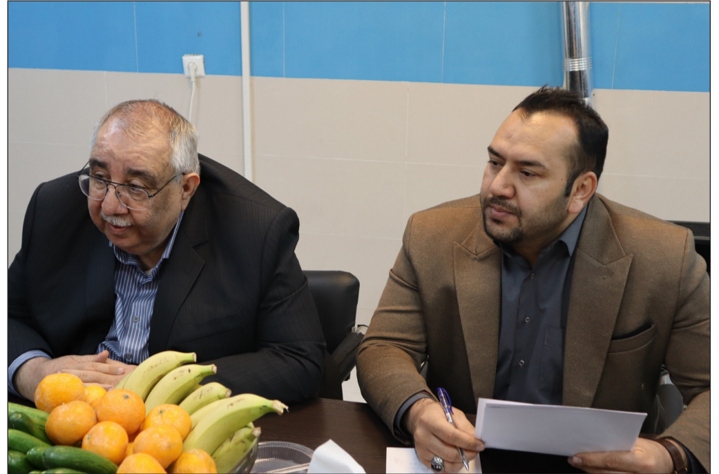
رئیس بیمارستان فاطمیه با درود، از دستاوردهای ارزشمند بیمارستان فاطمیه با درود در دی ماهی ۱۴۰۳ خبر داد

شایان ذکر است در مرحله اول توزیع آمبولانس‌ها در سال جاری، تعداد ۷ دستگاه آمبولانس به استان تحویل شد و قرار است تا پایان امسال تعداد ۶ دستگاه آمبولانس دیگر نیز به ناوگان اورژانس ۱۱۵ استان اصفهان اضافه گردد.