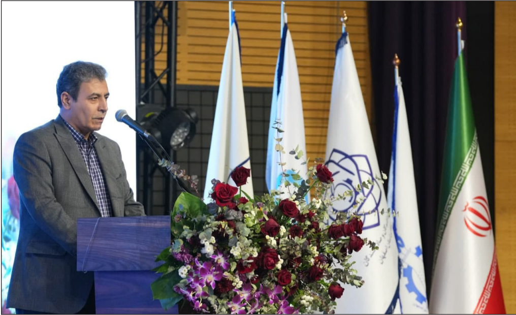
گردهمایی بزرگ صنعت غذای استان اصفهان

شنبه ۲۲ دی ماه، گردهمایی بزرگ صنعت غذای استان همراه با تجلیل از تولیدکنندگان، صادرکنندگان و مسئولین فنی برتر و پیشکسوتان استان اصفهان، در سالن قلب شهر اصفهان سیتی سنتر برگزار گردید. در این مراسم که با حضور مسئولین دانشگاه و معاونت غذا و دارو، نمایندگان مجلس شورای اسلامی، روسای هیات مدیره انجمن کارفرمایان صنایع غذایی استان و انجمن مسئولین فنی صنایع غذایی استان برگزار شد، دکتر مهدی پیرصالحی، معاون وزیر بهداشت طی سخنانی در حاشیه برگزاری این گردهمایی اظهار کرد: صنعت غذا نقش بسیار مؤثری در سلامت و کیفیت زندگی مردم دارد. از این رو، سازمان غذا و دارو نظارت جدی بر کیفیت، ایمنی و استانداردهای مواد غذایی دارد تا اطمینان حاصل شود که غذایی که به دست مردم می‌رسد، سالم و باکیفیت است. وی با اشاره به اهمیت تغذیه سالم در جامعه امروز افزود: با توجه به افزایش آگاهی مردم، تقاضا برای غذای سالم بیشتر شده است. این مسئله فرصتی برای فعالان حوزه غذاست تا با نوآوری و بهبود فرایندهای تولید، سهم خود را در بازارهای داخلی و جهانی افزایش دهند.