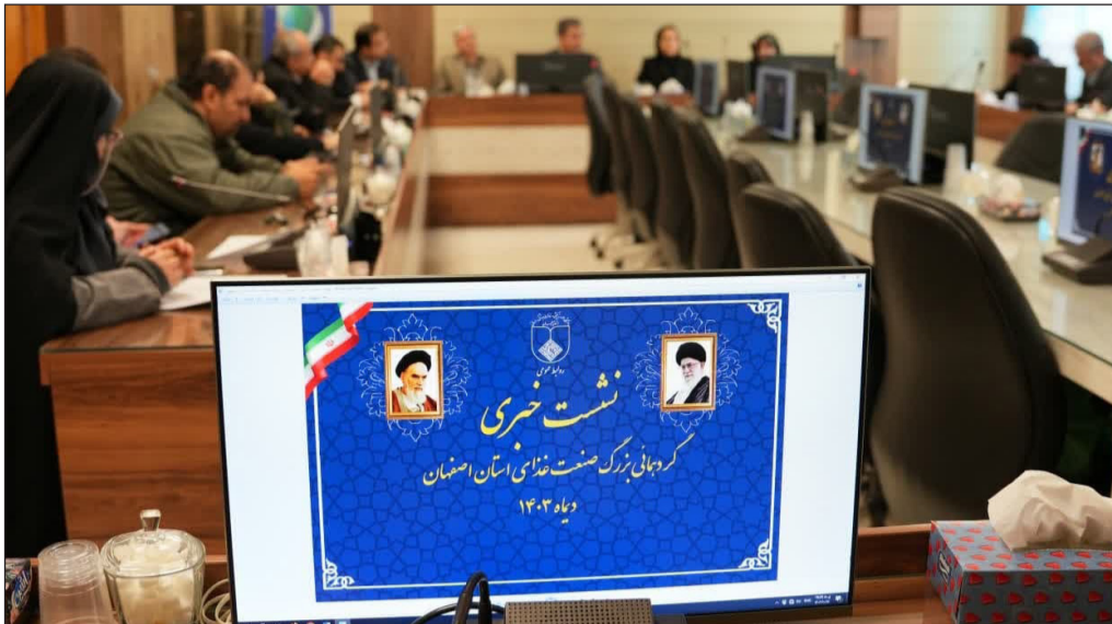
بمناسبت گردهمایی بزرگ صنعت غذای اصفهان، نشست خبری برگزار شد