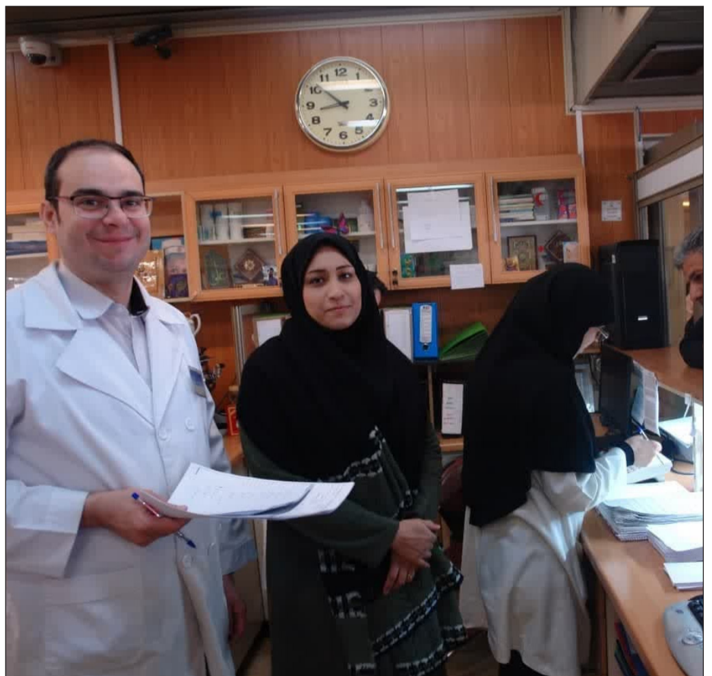
اجرای طرح کرامت علوی دانشکده دندانپزشکی برای مددجویان تحت پوشش کمیته امداد سازمان بهزیستی

در ادامه بحث و تبادل نظر در راستای پیگیری برنامه‌های مراقبت بیماری‌های تنفسی و وظایف مراکز و پایگاه‌های مراقبت مرزی صورت گرفت.