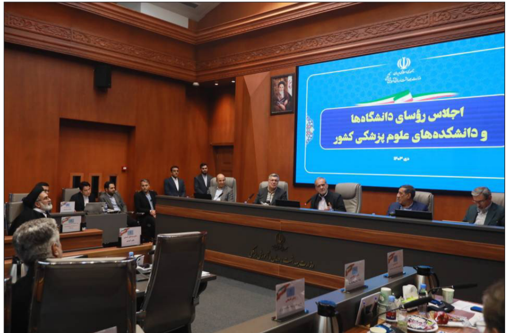
حضور دکتر پزشکیان رئیس جمهور در اجلاس روسای دانشگاه‌ها و دانشکده‌های علوم پزشکی

وی افزود: مدت زمان مشخصی برای ارسال مدارک و مستندات از سوی مدیران عامل و مسئولان فنی تعیین و پس از پایان مهلت، ارزیابی‌ها به‌طور کامل انجام گردید و تمامی صنایع غذایی تحت پوشش مورد بررسی قرار گرفتند. مدیر نظارت بر مواد غذایی، آشامیدنی، آرایشی و بهداشتی نیز خاطر نشان کرد: برگزاری این همایش‌ها و نمایشگاه‌ها به‌عنوان انگیزه‌ای برای مسئولان واحدها می‌باشد تا نواقص خود را شناسایی و برطرف نمایند.